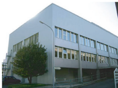
Messinastrasse 5, Triesen